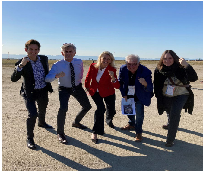
万博の開催地、夢洲を訪れてスタートを切る「チーム・カナダ」のメンバー(2022/10)

カナダは、2025年4月13日から10月13日まで開催される2025年大阪・関西万博に参加することをとても光栄に思っています(そしてワクワクしています)! カナダパビリオンで日本の皆様に素晴らしいカナダ体験をお届けして人気を集め、大きな成功を収めた2005年の愛知万博、1970年の大阪万博に続いて、また関西を訪れることを楽しみにしています。私たち「チーム・カナダ」は、来場される大勢の方々の記憶に残る魅力的なパビリオンと体験を企画し、形にするための準備に忙しい毎日です。